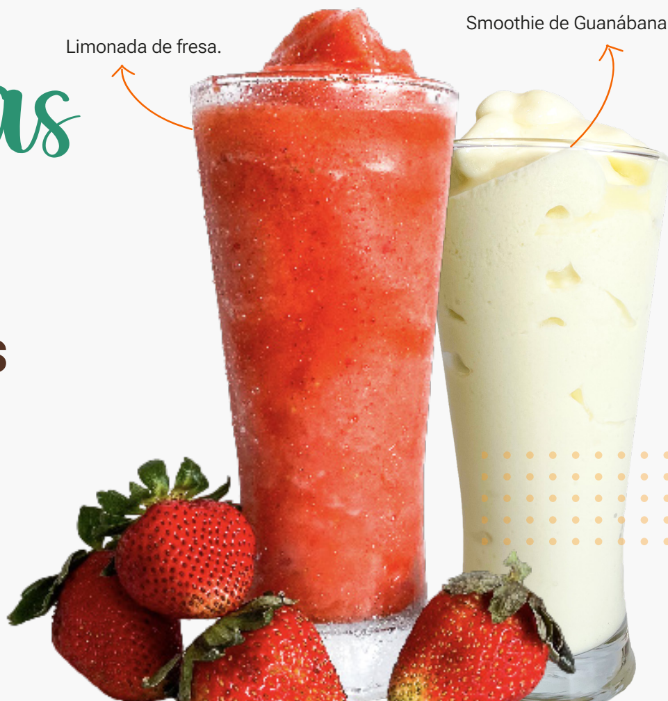
Smoothie de Guanábana.