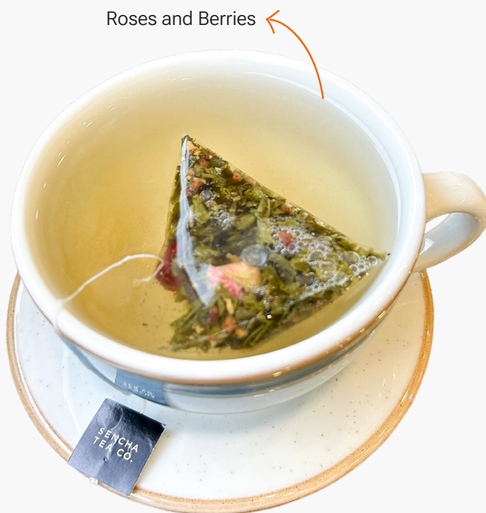
Roses and Berries